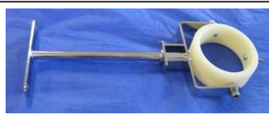
28.104- 万向接头臂和捕集管固定环