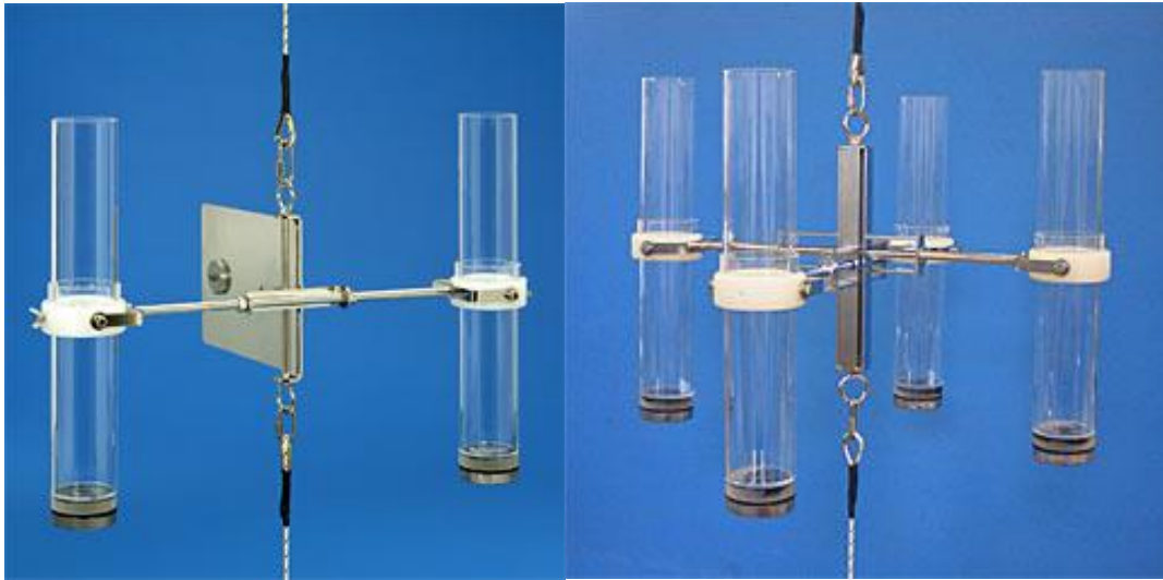
28.150- 双通道沉积物捕集器